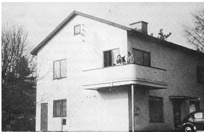
Affären vid Torbjörnsbacken år 1960