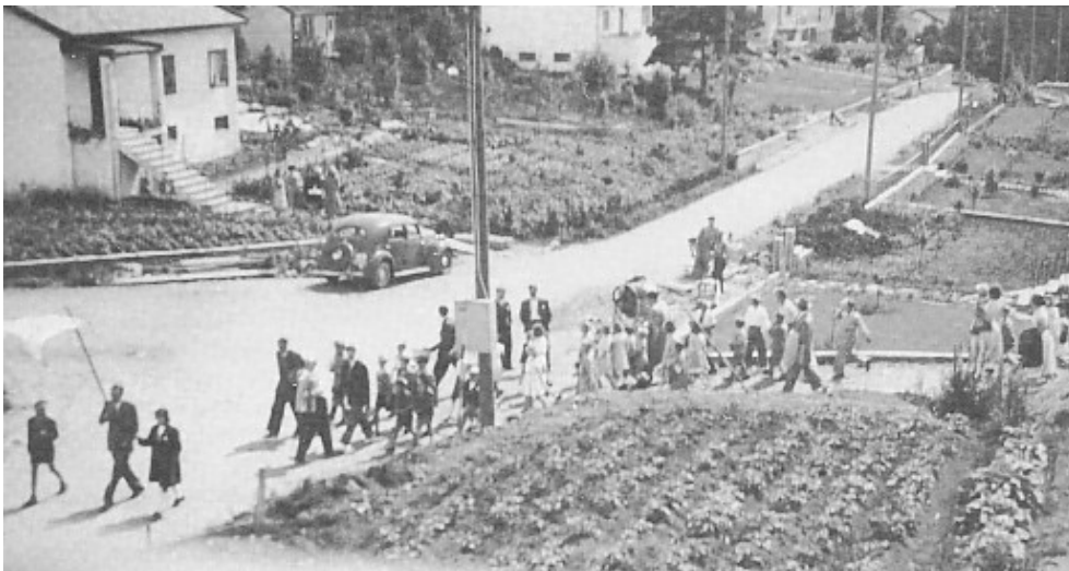
Korsningen Ljungliden - Myrekärrsvägen 1948. Egnahemsföreningen på marsch mot midsommarfest.