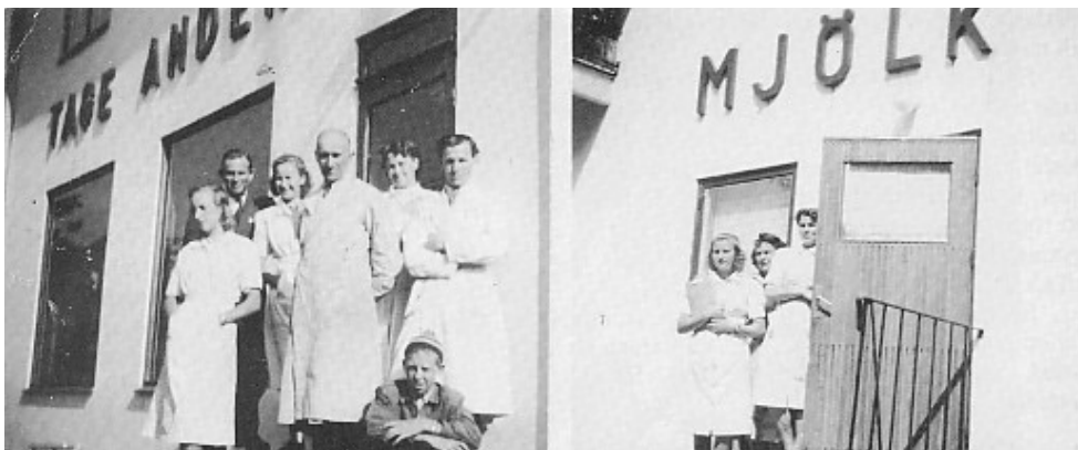
Personal utanför butiken Myrekärsvägen 1 omkring år 1950