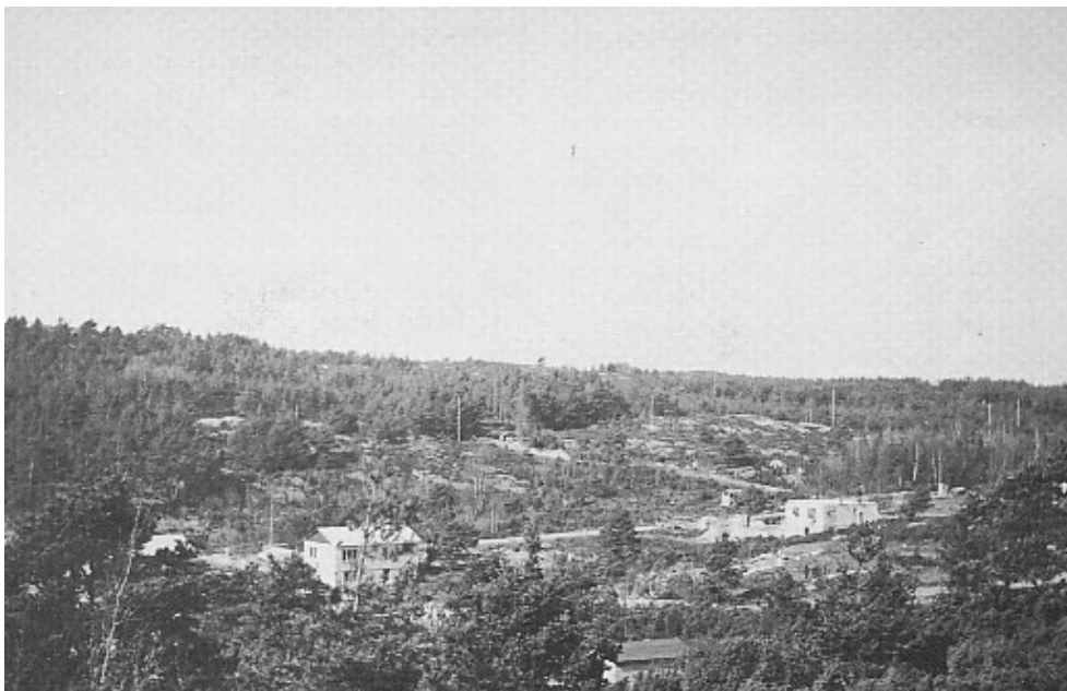
Våren 1945. Vy över Kärrdalen mot Torbjörnsleden