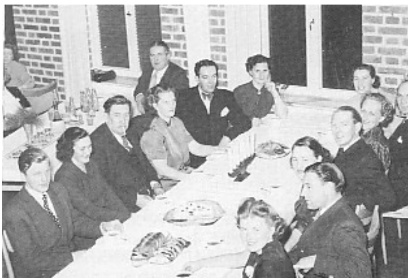
Bord med kärrdalsbor 1950